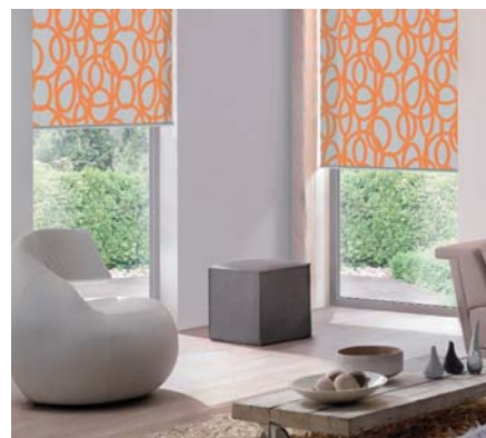
VNITŘNÍ LÁTKOVÉ STÍNĚNÍ