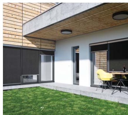
SVISLÉ FASÁDNÍ CLONY